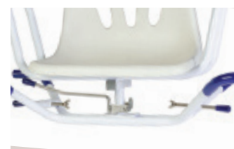
Stabilisateurs latéraux et manette de verrouillage