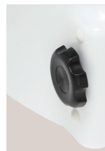
Molettes de réglage