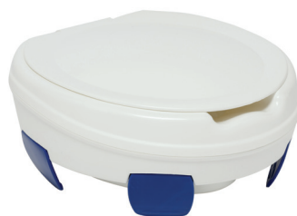
Clipper® III avec couvercle