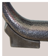
Cale anti bascule