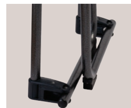
Système de pliage